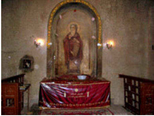
Η λάρνακα του Αγίου Αθανασίου />(όπου υπάρχουν τα λείψανά του)<br />κάτω από τον καθεδρικό ναό του<br />Αγίου Μάρκου, Κάιρο