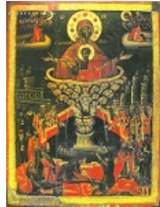
Ζωοδόχος Πηγή - Φορητή εικόνα, έργο του εργαστηρίου του Αγιορείτου Ιερομονάχου Παρθενίου του Σκούρτου του εξ Αγράφων. Μελένικο Βουλγαρίας