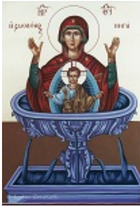
Ζωοδόχος Πηγή - Λυδία Γουριώτη© (lydiagourioti- iconography.blogspot.com)