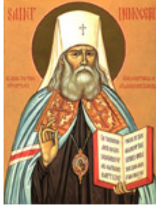
Όσιος Ιννοκέντιος Βενιάμινωφ Μητροπολίτης Μόσχας και Ιεραπόστολος Αλάσκας