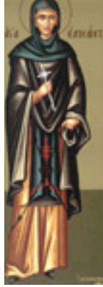
Οσία Ελισάβετ η<br />Θαυματουργή