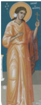
Οσία Ελισάβετ η<br />Θαυματουργή