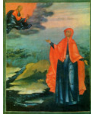
Οσία Ελισάβετ η<br />Θαυματουργή