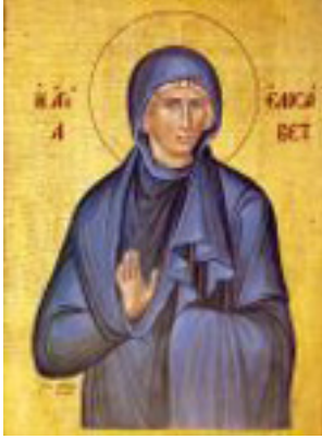
Οσία Ελισάβετ η<br />Θαυματουργή