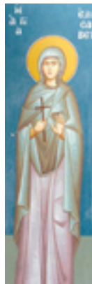
Οσία Ελισάβετ η<br />Θαυματουργή