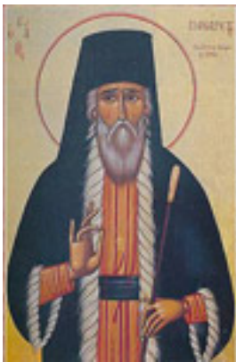
Άγιος Πανάρετος Αρχιεπίσκοπος Πάφου