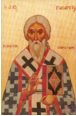
Άγιος Πανάρετος Αρχιεπίσκοπος Πάφου