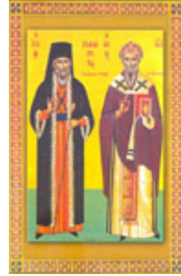
Άγιος Πανάρετος Αρχιεπίσκοπος Πάφου