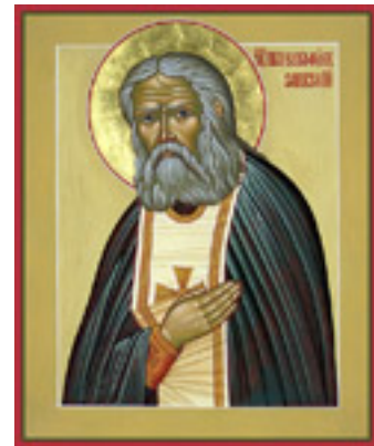
Όσιος Σεραφεΐμ του Σαρώφ