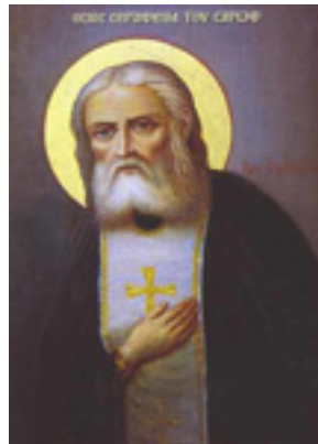
Όσιος Σεραφεΐμ του Σαρώφ