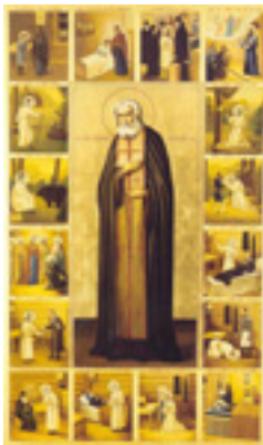
Όσιος Σεραφεΐμ του Σαρώφ