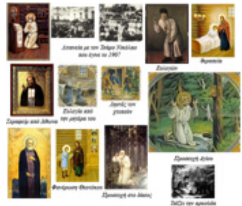
Όσιος Σεραφεΐμ του Σαρώφ