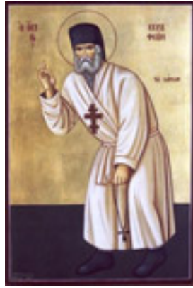
Όσιος Σεραφεΐμ του Σαρώφ