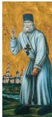
Όσιος Σεραφεΐμ του Σαρώφ