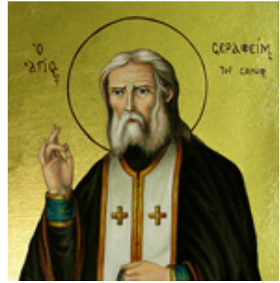
Όσιος Σεραφεΐμ του Σαρώφ