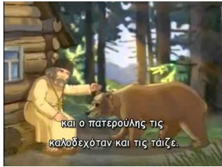
Ο Άγιος Σεραφεΐμ του Σαρώφ ο Θαυματουργός (για παιδιά)