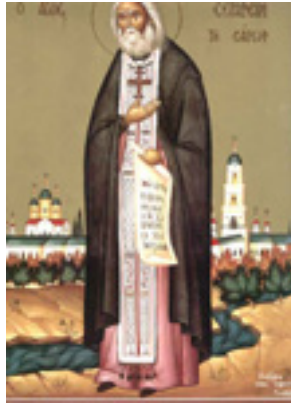
Όσιος Σεραφεΐμ του Σαρώφ