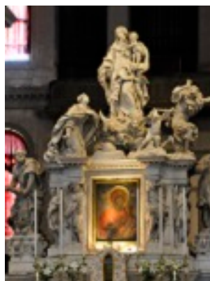
Η αυθεντική εικόνα της Υπεραγίας Θεοτόκου της Μεσοπαντητίσσης στον ναό της Santa Maria della Salute