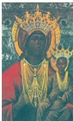
Σύναξη Υπεραγίας Θεοτόκου της Μεσοπαντητίσσης