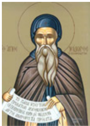
Όσιος Ισίδωρος ο Πηλουσιώτης