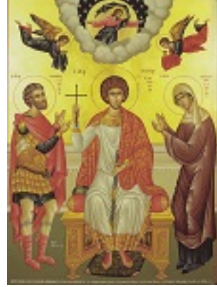
Άγιος Μεγαλομάρτυς Γεώργιος Τροπαιοφόρος μετά των γονέων του