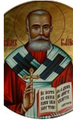
Άγιος Πλάτων ο Ιερομάρτυρας επίσκοπος Μπάνια Λούκα