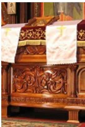
Άγιος Πλάτων ο Ιερομάρτυρας επίσκοπος Μπάνια Λούκα