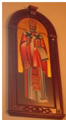
Άγιος Πλάτων ο Ιερομάρτυρας επίσκοπος Μπάνια Λούκα