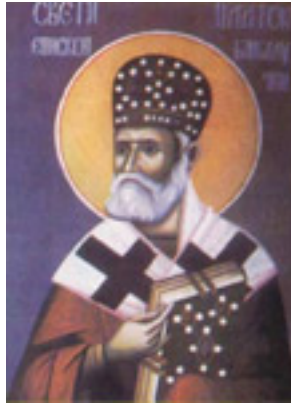
Άγιος Πλάτων ο Ιερομάρτυρας επίσκοπος Μπάνια Λούκα