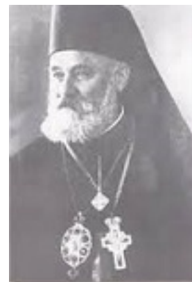
Άγιος Πλάτων ο Ιερομάρτυρας επίσκοπος Μπάνια Λούκα