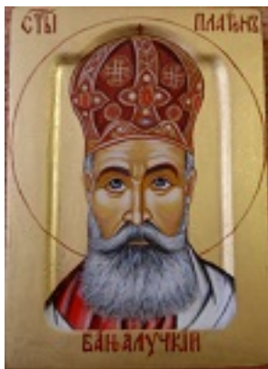
Άγιος Πλάτων ο Ιερομάρτυρας επίσκοπος Μπάνια Λούκα