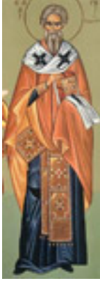
Όσιος Θεόδωρος ο Συκεώτης επίσκοπος Αναστασιουπόλεως