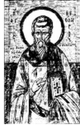
Όσιος Θεόδωρος ο Συκεώτης επίσκοπος Αναστασιουπόλεως - Φώτης Κόντογλου