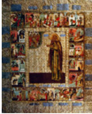
Όσιος Θεόδωρος ο Συκεώτης επίσκοπος Αναστασιουπόλεως