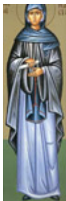
Οσία Αθανασία εξ Αιγίνης η Θαυματουργός