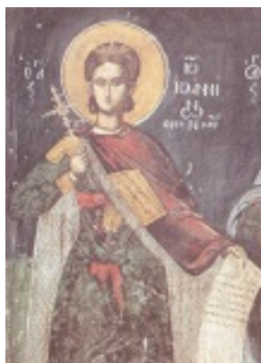
Άγιος Ιωάννης ο Ράπτης ο Νεομάρτυρας εξ Ιωαννίνων