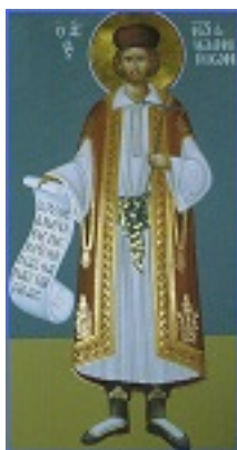
Άγιος Ιωάννης ο Ράπτης ο Νεομάρτυρας εξ Ιωαννίνων