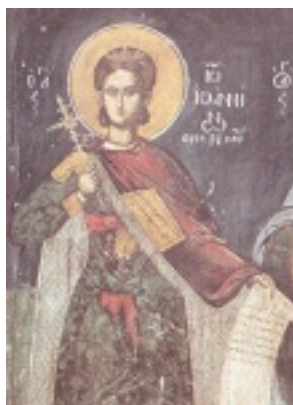
Άγιος Ιωάννης ο Ράπτης ο Νεομάρτυρας εξ Ιωαννίνων