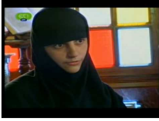
Ιερά λείψανα οσιομαρτύρων Νταού Πεντέλης