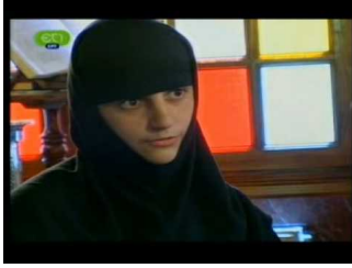
Ιερά λείψανα οσιομαρτύρων Νταού Πεντέλης