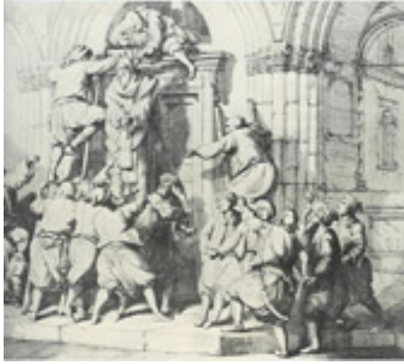
Ο απαγχονισμός του Πατριάρχη Γρηγορίου Ε΄