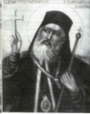
Άγιος Γρηγόριος Ε' Πατριάρχης Κωνσταντινουπόλεως