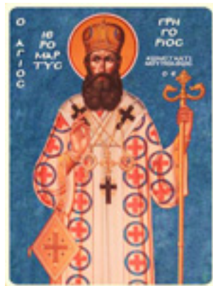
Άγιος Γρηγόριος Ε' Πατριάρχης Κωνσταντινουπόλεως