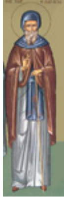
Όσιος Γεώργιος ο Χοζεβίτης