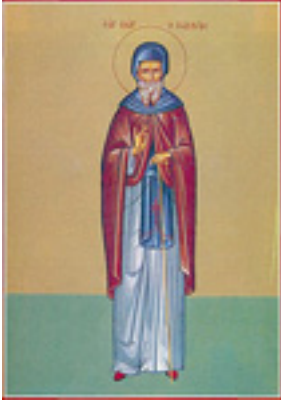
Όσιος Γεώργιος ο Χοζεβίτης