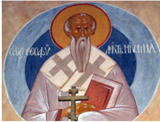
Όσιος Θεοφύλακτος Επίσκοπος Νικομήδειας