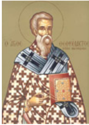
Όσιος Θεοφύλακτος Επίσκοπος Νικομήδειας