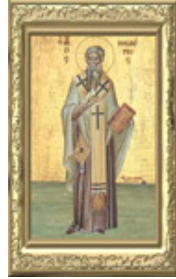
Άγιος Μελέτιος Αρχιεπίσκοπος Αντιοχείας