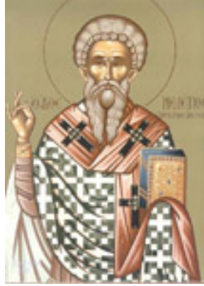
Άγιος Μελέτιος Αρχιεπίσκοπος Αντιοχείας