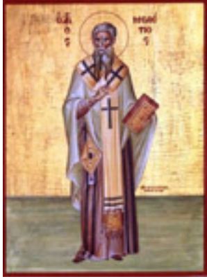
Άγιος Μελέτιος Αρχιεπίσκοπος Αντιοχείας