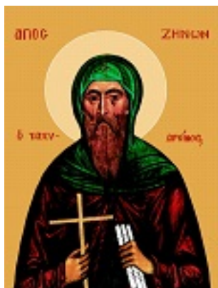
Ἅγιος Ζήνων ο Ταχυδρόμος