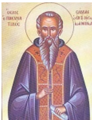
Όσιος Σάββας ο Πνευματικός