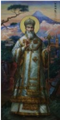
Άγιος Νικόλαος ο Ισαπόστολος