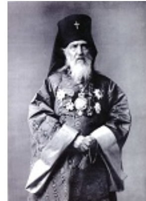
Άγιος Νικόλαος ο Ισαπόστολος