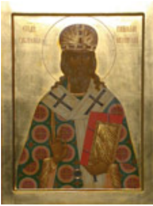
Άγιος Νικόλαος ο Ισαπόστολος