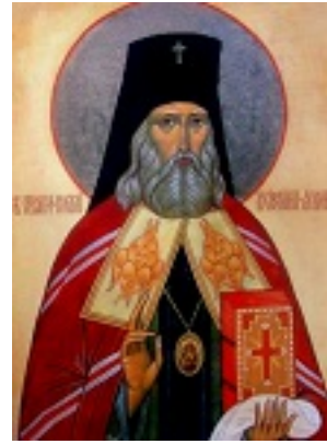
Άγιος Νικόλαος ο Ισαπόστολος