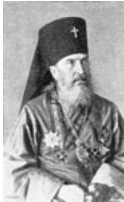
Άγιος Νικόλαος ο Ισαπόστολος