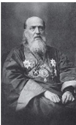
Άγιος Νικόλαος ο Ισαπόστολος