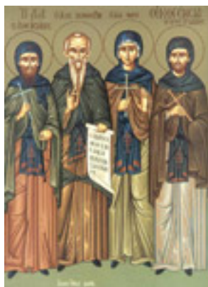
Όσιος Ξενοφών μετά της συμβίου του Μαρίας και των τέκνων Αρκαδίου και Ιωάννη