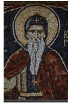
Όσιος Κλήμης ο εν τω Όρει Σαγματιώ άσκησας