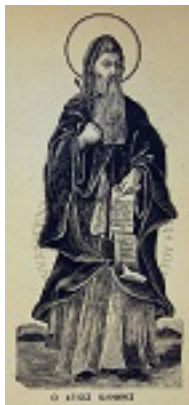
Όσιος Κλήμης ο εν τω Όρει Σαγματιώ άσκησας