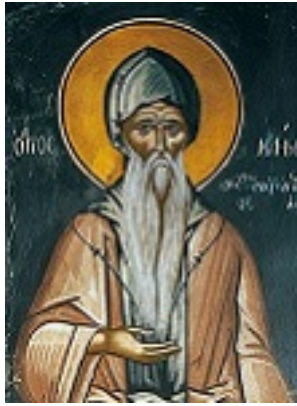
Όσιος Κλήμης ο εν τω Όρει Σαγματιώ άσκησας