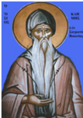
Όσιος Κλήμης ο εν τω Όρει Σαγματιώ άσκησας