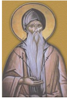
Όσιος Κλήμης ο εν τω Όρει Σαγματιώ άσκησας