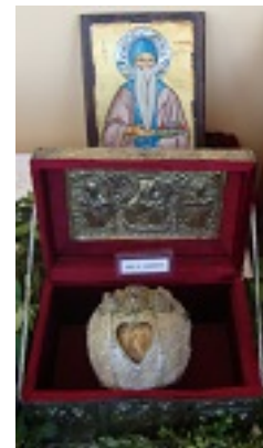
Η Τιμία Κάρα του Οσίου Κλήμη