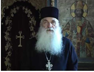
Ιερά μονή Μεταμορφώσεως του Σωτήρος Σαγματά Βοιωτίας