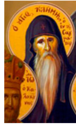
Όσιος Κλήμης ο εν τω Όρει Σαγματιώ άσκησας