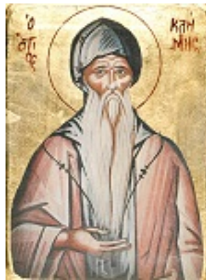
Όσιος Κλήμης ο εν τω Όρει Σαγματιώ άσκησας