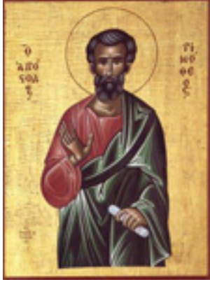
Άγιος Τιμόθεος ο Απόστολος