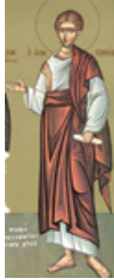
Άγιος Τιμόθεος ο Απόστολος