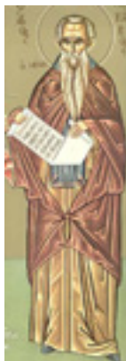
Όσιος Μακάριος ο Αιγύπτιος