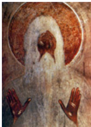
Όσιος Μακάριος ο Αιγύπτιος