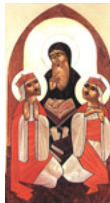
Όσιος Μακάριος ο Αιγύπτιος