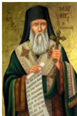
Άγιος Μάρκος ο Ευγενικός