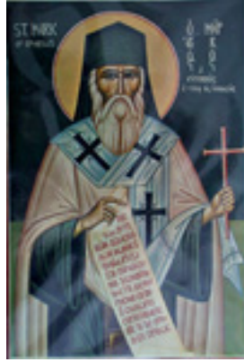
Άγιος Μάρκος ο Ευγενικός