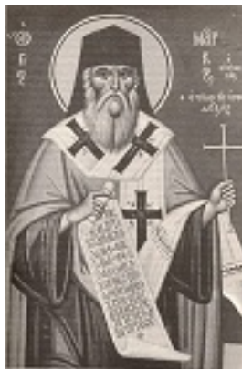
Άγιος Μάρκος ο Ευγενικός - Φώτης Κόντογλου