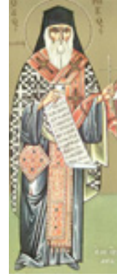
Άγιος Μάρκος ο Ευγενικός