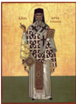
Άγιος Μάρκος ο Ευγενικός