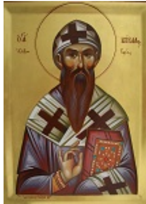
Άγιος Κύριλλος Πατριάρχης Αλεξανδρείας (Ι.Μ. Προφ. Ηλιού Σερρών)