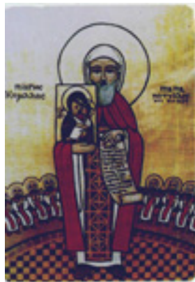
Άγιος Κύριλλος Πατριάρχης Αλεξανδρείας