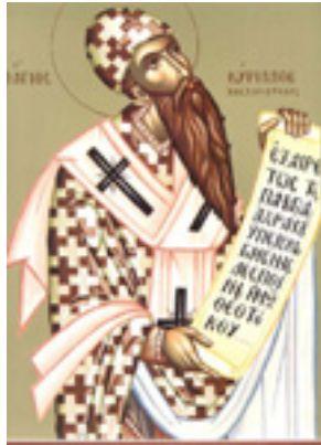
Άγιος Κύριλλος Πατριάρχης Αλεξανδρείας