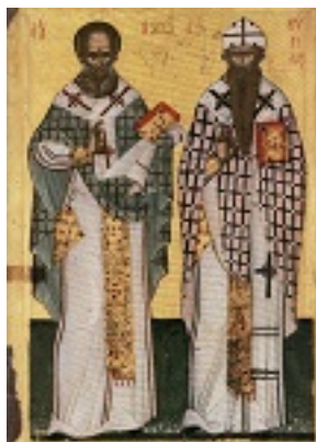
Άγιοι Αθανάσιος ο Μέγας και Κύριλλος Πατριάρχες Αλεξανδρείας