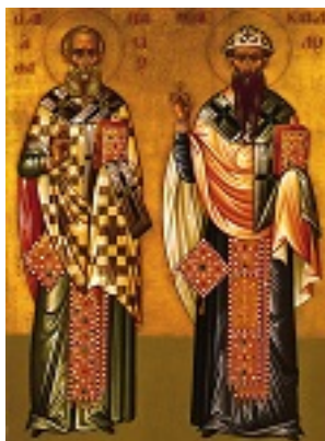
Άγιοι Αθανάσιος ο Μέγας και Κύριλλος Πατριάρχες Αλεξανδρείας