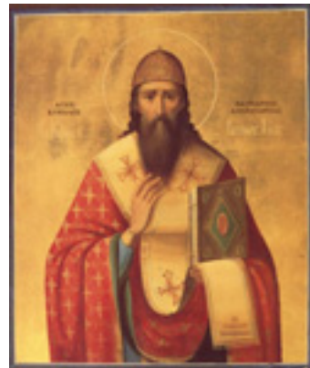
Άγιος Κύριλλος Πατριάρχης Αλεξανδρείας