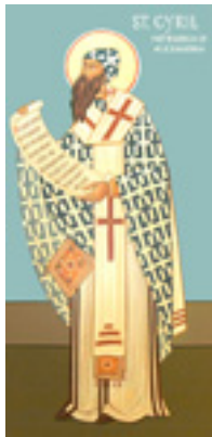
Άγιος Κύριλλος Πατριάρχης Αλεξανδρείας