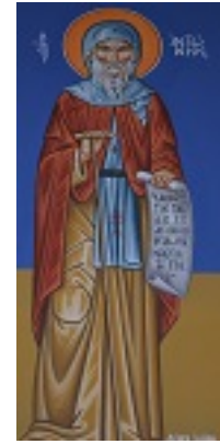
Άγιος Αντώνιος ο Μέγας - Ιερός Ναός Παντανάσσης Νάουσας Πάρου