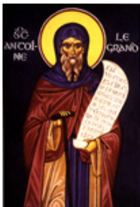
Άγιος Αντώνιος ο Μέγας