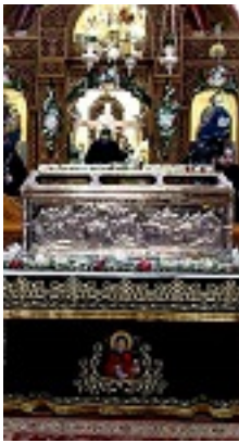
Η λάρνακα του Οσίου Αντωνίου του Νέου Πολιούχο Βεροίας μέσα στον Ιερό Ναό του