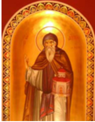
Όσιος Αντώνιος ο νέος ο Θαυματουργός