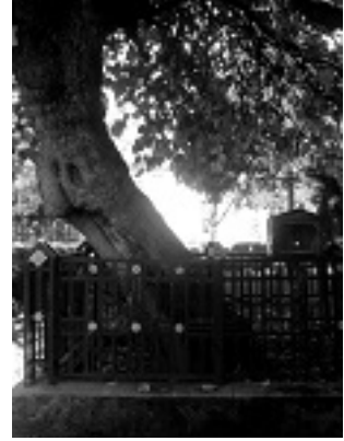
Η μουριά στην οποία σταμάτησε το κάρο με το λείψανο του Οσίου Αντωνίου του Νέου