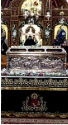
Η λάρνακα του Οσίου Αντωνίου του Νέου Πολιούχο Βεροίας μέσα στον Ιερό Ναό του