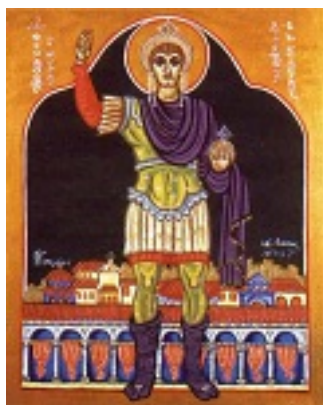
Άγιος Θεοδοσίος ο Μεγάλος ο βασιλεύς