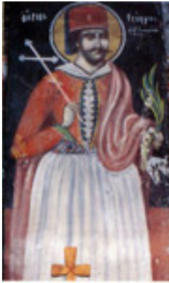
Άγιος Γεώργιος ο Νέος εξ Ιωαννίνων - Μονή Αγ. Νικολάου Σκλίβανης