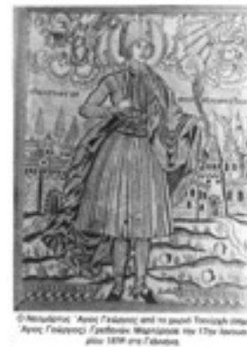
Άγιος Γεώργιος ο Νέος εξ Ιωαννίνων