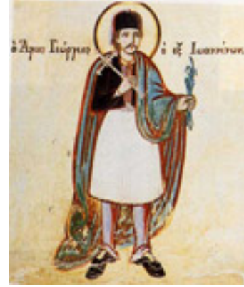
Τοιχογραφία του καθολικού της μονής Αγ. Τριάδας Παλιοχωρίου Λάιστας