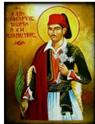
Άγιος Γεώργιος ο Νέος εξ Ιωαννίνων - Χρήστος Στύλος©