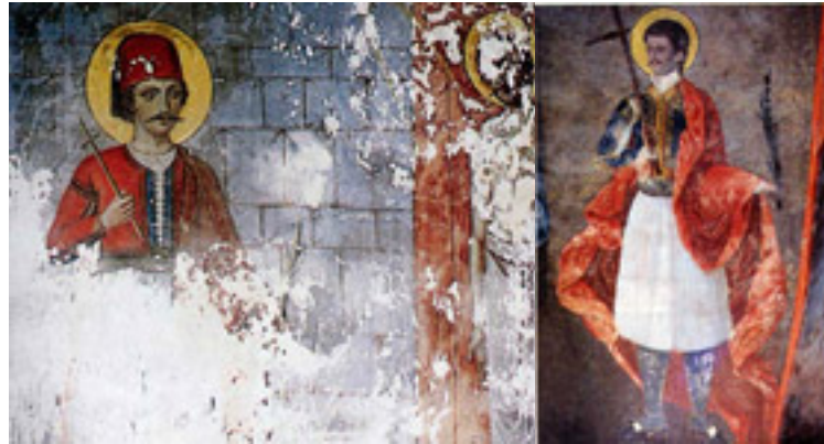
Τοιχογραφία του 1918 μ.Χ. από την Μονή Προφήτη Ηλία του Νησιού των Ιωαννίνων