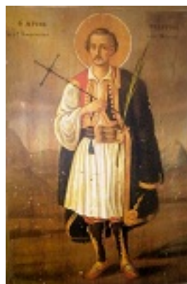
Άγιος Γεώργιος ο Νέος εξ Ιωαννίνων - Ιερός Ναός Αγίου Γεωργίου και Αγίου Δημητρίου Παλαιοχώρας Αίγινας