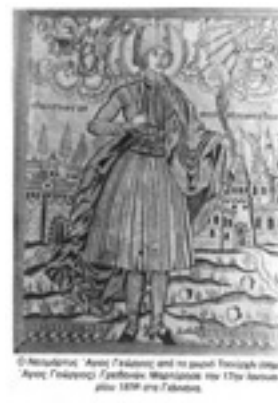
Άγιος Γεώργιος ο Νέος εξ Ιωαννίνων