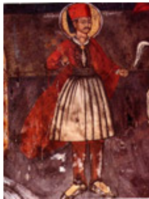
Από τη Μονή Αβασσού της μικρής Λάκκας Σουλίου ή Λακκοπούλας