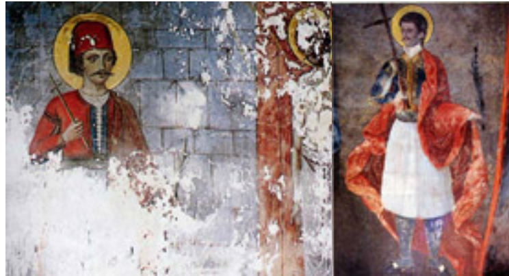
Τοιχογραφία του 1918 μ.Χ. από την Μονή Προφήτη Ηλία του Νησιού των Ιωαννίνων