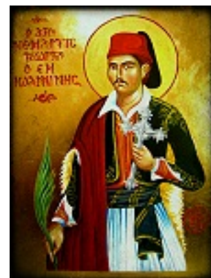
Άγιος Γεώργιος ο Νέος εξ Ιωαννίνων - Χρήστος Στύλος©