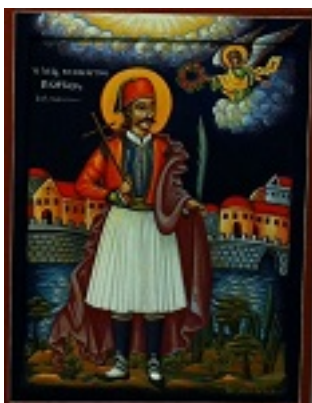
Άγιος Γεώργιος ο Νέος εξ Ιωαννίνων - Αγγελική Τσέλιου© (diaxeirosaggelikistseliou. blogspot.com)