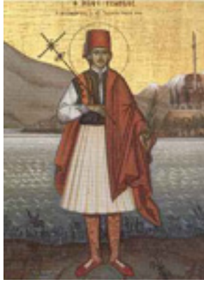
Άγιος Γεώργιος ο Νέος εξ Ιωαννίνων Η πρώτη φορητή εικόνα του Αγίου η οποία έγινε στις 30/01/1838 μ.Χ., 13 ημέρες μετά το μαρτύριο του. «Δια χειρός Ζήκου Χιοναδίτου» και με έξοδα του ιερομόναχου Χρύσανθου Λαϊνά