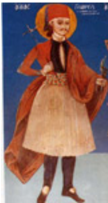
Ιερά Μονή Αγ. Αικατερίνης Σχωρετσιανών, πάνω από το σημερινό χωριό Καταρράκτης Τζουμέρκων