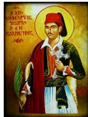
Άγιος Γεώργιος ο Νέος εξ Ιωαννίνων - Χρήστος Στύλος©