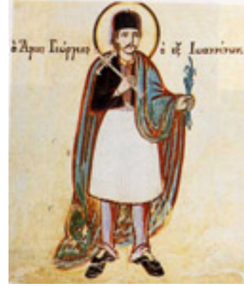
Τοιχογραφία του καθολικού της μονής Αγ. Τριάδας Παλιοχωρίου Λάιστας