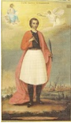
Άγιος Γεώργιος ο Νέος εξ Ιωαννίνων