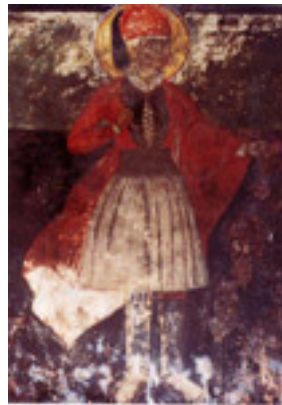
Τοιχογραφία του καθολικού της Μονής Αγ. Γεωργίου Κρανιάς, ανάμεσα από το Θεσπρωτικό και την Κρανιά