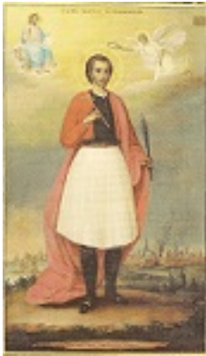
Άγιος Γεώργιος ο Νέος εξ Ιωαννίνων