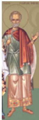
Άγιος Γεώργιος (ή Ζώρζης ή Γκιουρτζής) ο Ίβηρ