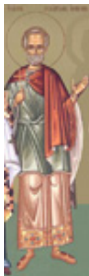
Άγιος Γεώργιος (ή Ζώρζης ή Γκιουρτζής) ο Ίβηρ