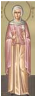
Αγία Ανυσία η Οσιομάρτυς από τη Θεσσαλονίκη