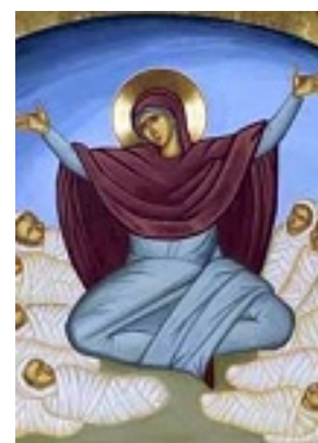
Ο Θρήνος της Ραχήλ