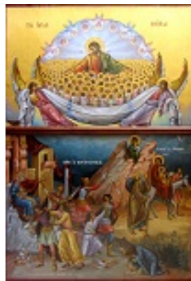
Άγια Νήπια και Βρεφοκτονία εις Βηθλεέμ