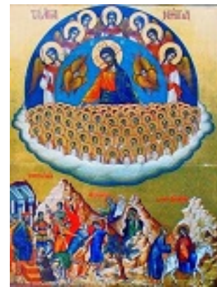
Άγια Νήπια και Βρεφοκτονία εις Βηθλεέμ