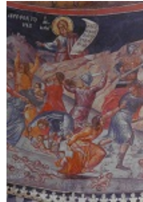
Η βρεφοκτονία του Ηρώδη (τμήμα) - Ιερά Μονή Μεγίστης Λαύρας, Τοιχογραφία Καθολικού