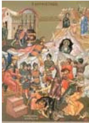
Η Σφαγή των 14.000 Νηπίων