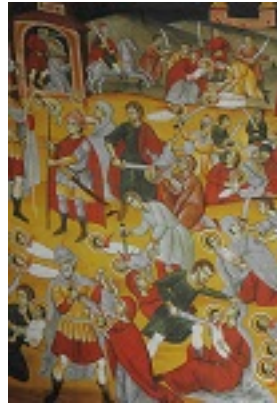
Η βρεφοκτονία του Ηρώδη (λεπτομέρεια) - Ιερά Μονή Ξηροποτάμου, Τοιχογραφία Καθολικού