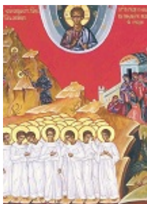
Άγια Νήπια και Βρεφοκτονία εις Βηθλεέμ