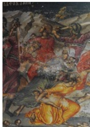
Λεπτομέρεια από τη Σφαγή των Νηπίων - Ιερά Μονή Σταυρονικήτα, Τοιχογραφία Θεοφάνους από το Καθολικό, 16ος αι. μ.Χ.