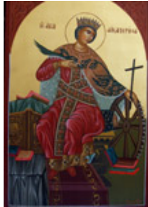
Αγία Αικατερίνη - Λυδία Γουριώτη© ( http://lydiagourioti- iconography.blogspot.com )