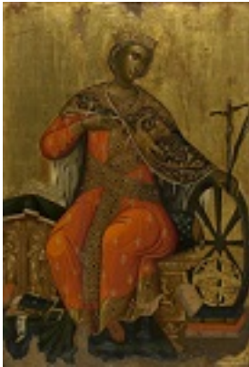
Αγία Αικατερίνη - Βίκτωρ - Β΄ μισό 17ου αιώνα μ.Χ. Από τη Messina - Αθήνα, Βυζαντινό και Χριστιανικό Μουσείο