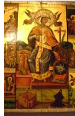
Αγία Αικατερίνη (Σινά)