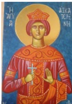
Αγία Αικατερίνη - Ησυχαστήριο «Παναγία των Βρυούλων»