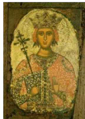
Αγία Αικατερίνη - τέλος 15ου - αρχές 16ου αι. μ.Χ. - Μονή Σίμωνος Πέτρας, Άγιον Όρος