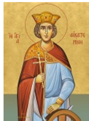
Αγία Αικατερίνη - Δια χειρός Νικ. Γαλανόπουλου - www.kapadokis.gr