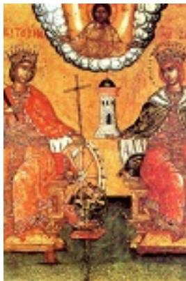
Η Αγία Αικατερίνη μαζί με την Αγία Βαρβάρα