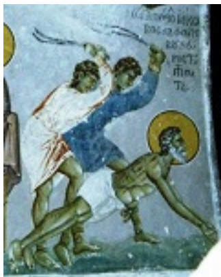
Άγιος Ιάκωβος του Αλφαίου, ο Απόστολος