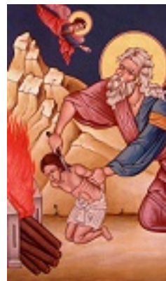
Η θυσία του Αβραάμ