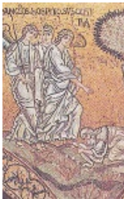
Ο Αβραάμ υποδέχεται τους 3 Αγγέλους