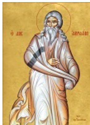
Δίκαιος Αβραάμ - Δια χειρός Νικ. Γαλανόπουλου – www.karadokis.gr