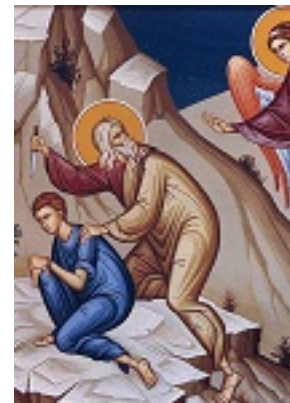
Η θυσία του Αβραάμ