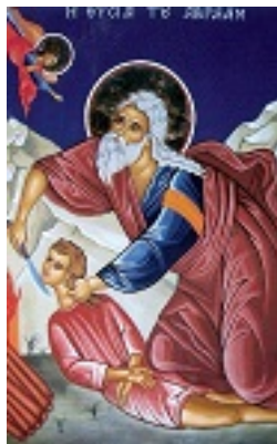
Η θυσία του Αβραάμ