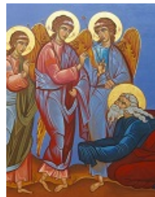
Ο Αβραάμ υποδέχεται τους 3 Αγγέλους