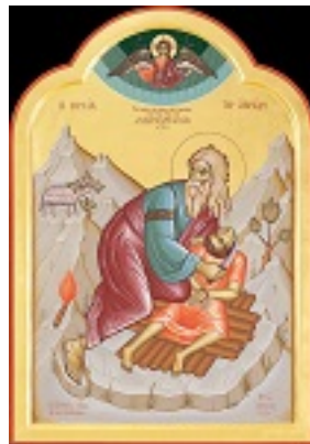
Η θυσία του Αβραάμ