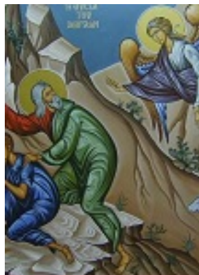
Η θυσία του Αβραάμ