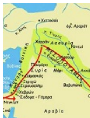
Χάρτης με τη διαδρομή του Αβραάμ