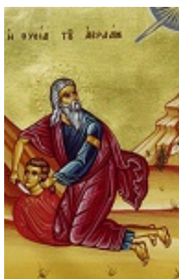
Η θυσία του Αβραάμ