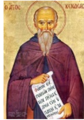
Όσιος Κενδέας ο θαυματουργός