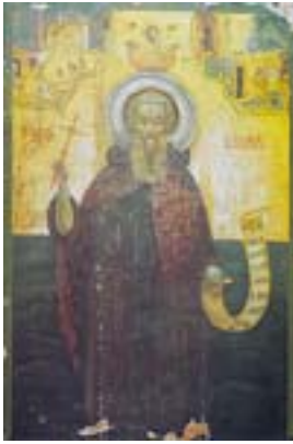
Όσιος Κενδέας ο θαυματουργός