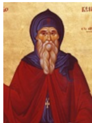
Όσιος Κενδέας ο θαυματουργός