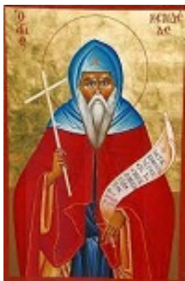
Όσιος Κενδέας ο θαυματουργός