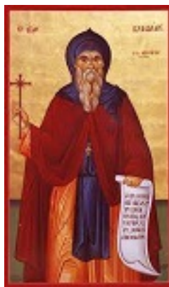
Όσιος Κενδέας ο θαυματουργός