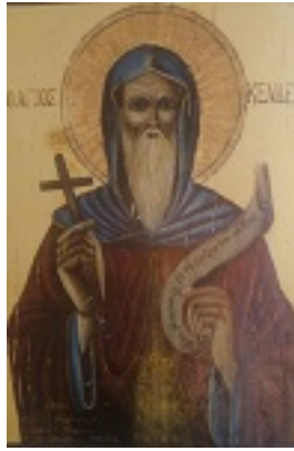
Όσιος Κενδέας ο θαυματουργός