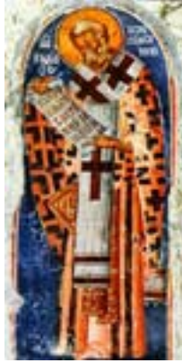
Άγιος Γρηγόριος ο Ιερομάρτυρας επίσκοπος της Μεγάλης Αρμενίας