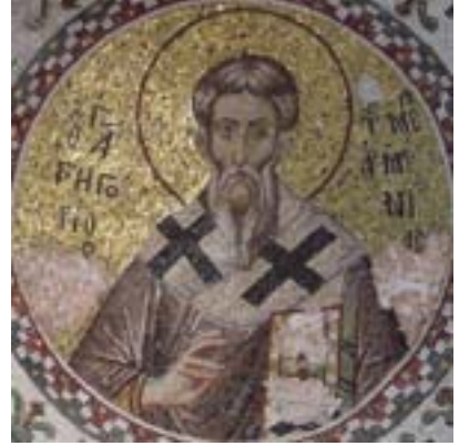
Άγιος Γρηγόριος ο Ιερομάρτυρας επίσκοπος της Μεγάλης Αρμενίας - 14ος αι. μ.Χ. Παμμακάριστος, Κωνσταντινούπολη