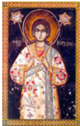
Άγιος Κύριλλος ο διάκονος