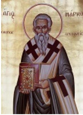
Άγιος Μάρκος επίσκοπος Αρεθουσίων