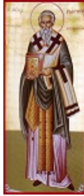
Άγιος Μάρκος επίσκοπος Αρεθουσίων