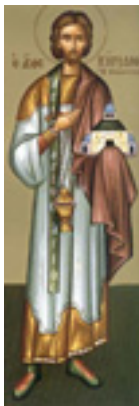
Άγιος Κύριλλος ο διάκονος