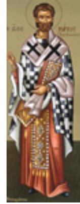
Άγιος Μάρκος επίσκοπος Αρεθουσίων