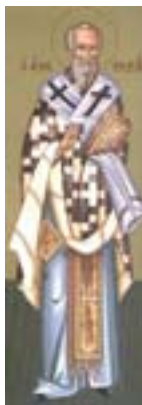
Άγιος Κοδράτος ο Απόστολος «ό έν Μαγνησία»