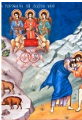
Κυριακή του Ασώτου