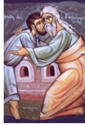
Κυριακή του Ασώτου