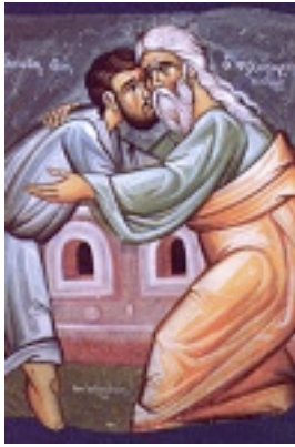
Κυριακή του Ασώτου