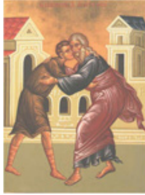
Κυριακή του Ασώτου